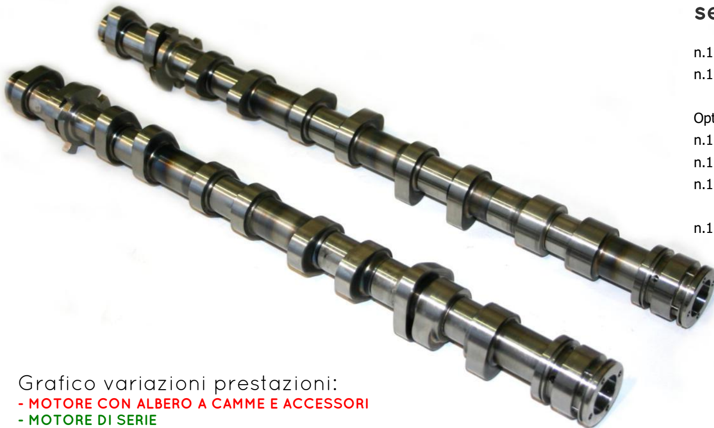
Grafico variazioni prestazioni: